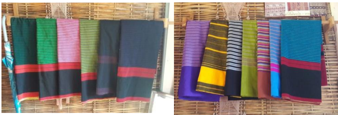
ภาพประกอบ ผ้าขึ้นสีแบบดั้งเดิม(ชาย) และสีแบบสมัยนิยม(ขวา)

แต่เมื่อไม่กี่ปีที่ผ่านมา ทางสังคมส่วนใหญ่ได้ให้ความสำคัญกับผ้าทอพื้นเมืองมากขึ้น สังเกตได้จาก รายการต่างๆที่ยกผ้าไทยมาสวมใส่ เช่น รายการทอผ้าไทย รายการนี้เปิดโอกาสให้นักศึกษาและนิสิตและนักศึกษาสามารถร่วมกัน ออกแบบชุดที่ทำจากผ้าไทยทั่วประเทศ ดังนั้นผู้คนจะเห็นว่าผ้าไทยสามารถนำมาทำเครื่องแต่งกายด้วยความสร้างสรรค์ได้ อีกมากมายและไม่ล้าสมัย หลังจากนั้นยอดขายของผ้าไทยได้ปรับตัวสูงขึ้น ทำให้กลุ่มทอผ้ามีเงินสะพัดมากขึ้น และ ประเด็นสำคัญคือคนรุ่นหลังได้สนใจการทอผ้ามากขึ้น