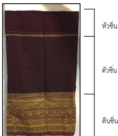
ภาพประกอบ ส่วนประกอบของผ้าชินตีนจก

ด้านลวดลายของผ้าเป็นลวดลายที่เฉพาะของอำเภอลับแล ประกอบด้วยลายหลักและลายประกอบในตัว ชิ้น 1 ผืน ส่วนการใช้อุปกรณ์ในการทอผ้าจะเป็นไม้ นิยมติดตั้งไว้ที่ใต้ถุนบ้านของผู้ทอ เพราะบ้านเรือนส่วนใหญ่จะยกได้ ถุนสูง เมื่อเสร็จจากทำไร่ทำสวนแล้ว แม่บ้านจะมานั่งทอผ้าใต้ถุนบ้านเป็นอาชีพเสริม วัสดุที่ใช้ในการทอเป็นวัสดุจาก ธรรมชาติ เช่น ฝ้าย ไหม สีย้อมไหม เป็นต้น ส่วนด้านสีที่นิยมทอผ้านั้นจะเป็นเอกลักษณ์ของชาวลับแลโบราณ ตั้งแต่สมัย อพยพมาจากอาณาจักรเชียงแสน ได้แก่ สีแดง สีดำ สีเขียวและสีเหลือง