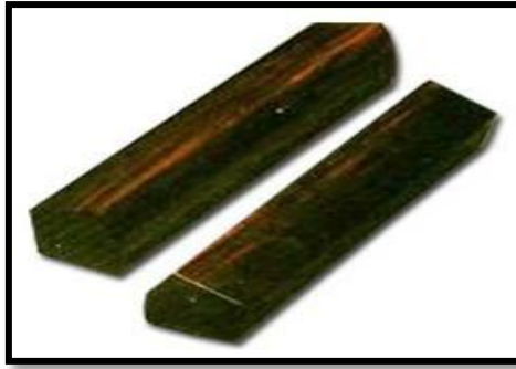
ภาพที่ 2 กรับ เครื่องประกอบจังหวะ