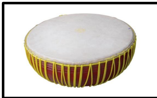
ภาพที่ 3 รำมะนา เครื่องประกอบจังหวะ

กรับ ทำด้วยไม้มีหลายชนิด คือ กรับคู่ กรับพวง และกรับสำหรับขับเสภา ลักษณะของแต่ละชนิดต่างกัน เช่น กรับคู่ทำจากไม้เฝ้หรือไม้จริง 2 อัน กรับพวง จะมีไม้ประกอบ 2 ข้าง ตรงกลางจะมีแผ่นโลหะยาวเท่าไม้ประกบร้อยเป็นพวงอยู่ระหว่างไม้ประกบ เวลาตีจะเกิดเสียงกราวๆ ผสมกัน กรับเสภา เป็นกรับพิเศษที่จะต้องใช้ไม้เนื้อแข็งแกร่ง เพราะต้องการเสียงคมชัดจึงใช้ไม้ชิงชัน