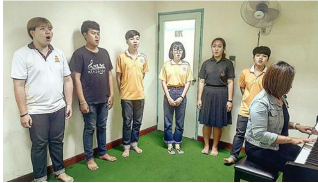
ภาพประกอบที่ 3 นิสิตกลุ่มที่ 2 นิสิตที่มีพื้นฐานการร้องเดี่ยวดีแต่ไม่เคยขับร้องประสานเสียง

3. คัดเลือกและแบ่งนิสิตเป็น 3 กลุ่มเพื่อปรับพื้นฐานและนำเข้าสู่กระบวนการวิจัยโดยนำผลจากการประเมินตนเองของนิสิต จัดนิสิตเป็น 3 กลุ่มดังนี้คือ 1.นิสิตที่มีพื้นฐานการร้องเพลงเดี่ยวไมตรี 2.นิสิตที่มีพื้นฐานการร้องเดี่ยวดีแต่ไม่เคยขับร้องประสานเสียง และ 3.นิสิตที่เคยผ่านการขับร้องประสานเสียงมาแล้วแต่ยังต้องการพัฒนาให้ดียิ่งขึ้น