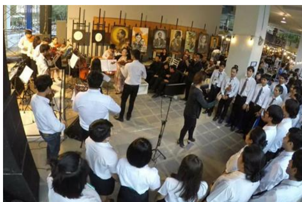
ภาพประกอบที่ 5 การแสดงผลงานทางดนตรีเพลงบัวขาวของวงประสานเสียงของมหาวิทยาลัยนเรศวร และวงเครื่องสายสากลของภาควิชาดนตรี มหาวิทยาลัยนเรศวร นำเสนอในรูปแบบงานคณะสถาปัตยกรรมศาสตร์ ในชื่อถนนศิลปะ (Street Art) และ เทิดพระเกียรติพระเจ้าอยู่หัวรัชกาลที่ 9