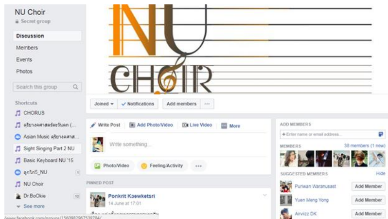
ภาพประกอบที่ 1 ห้องสมาชิกออนไลน์ชมรมวงขับร้องประสานเสียงมหาวิทยาลัยนเรศวร

1. เปิดรับสมัครนิสิตจากทุกๆ คณะในมหาวิทยาลัยนเรศวรเพื่อเข้าร่วมในชมรมวงขับร้องประสานเสียง มหาวิทยาลัยนเรศวร กลุ่มผู้วิจัยได้ดำเนินการประสานงานกับนิสิตจากคณะวิทยาศาสตร์การแพทย์เพื่อดำเนินการเปิดชมรมวงขับร้องประสานเสียงมหาวิทยาลัยนเรศวรโดยเปิดห้องสมาชิกออนไลน์ (Facebook page) เพื่อเป็นการรวบรวมสมาชิกให้ครบตามเกณฑ์ของมหาวิทยาลัย เพื่อเปิดดำเนินการจัดกิจกรรมต่างๆต่อไป โดยมีลักษณะดังนี้คือ