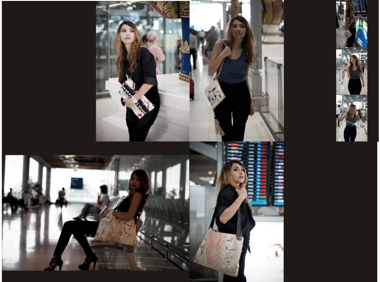
ปี 2016 - LEATHER BAG DESIGN COLLECTION MADE FROM USED CLOTHES FOR SPAIN CUSTOMERS